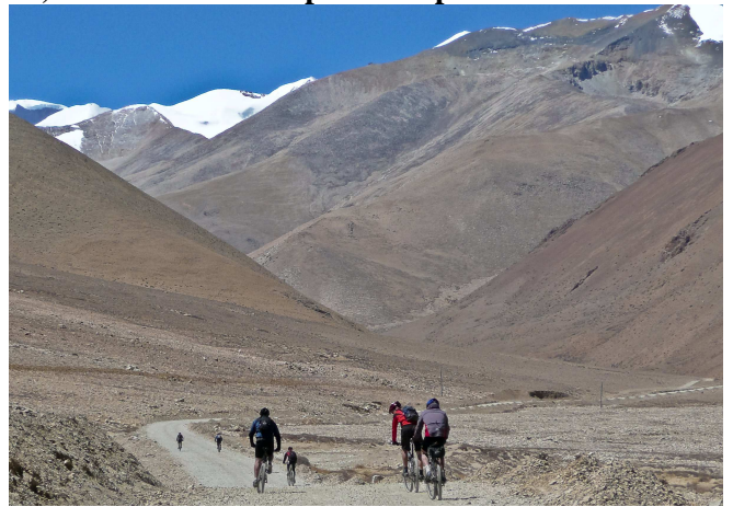
05) Puis chacun son rythme dans la montagne.