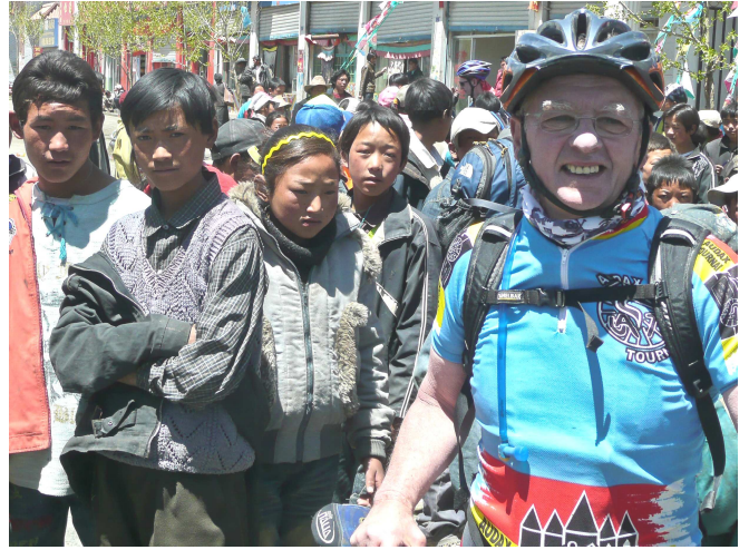
07) La foule des curieux qui viennent aux nouvelles.