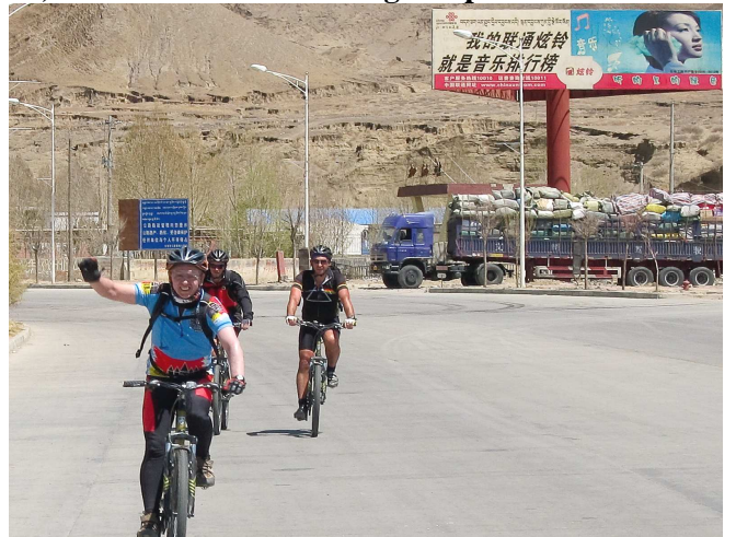
11) Avant de laisser éclater sa joie : Il l'a fait !