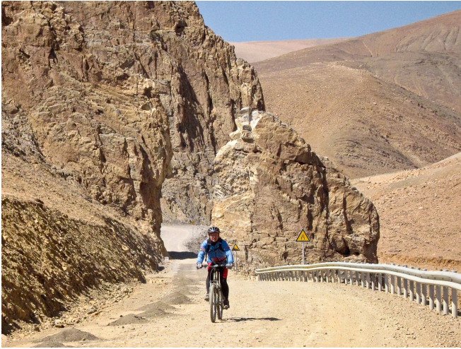
06) Passages étroits dans une montagne immense.