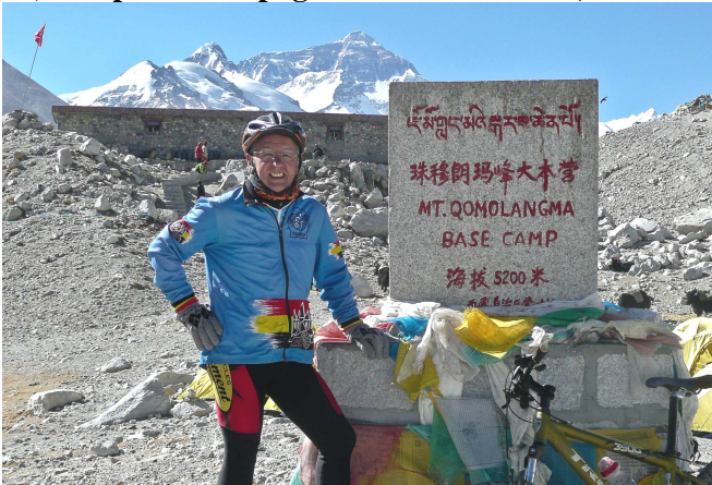
02) Camp de base pour l'ascension Everest 5200m