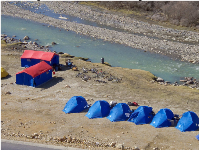
08) Un voyage de cyclo-campeurs très bien organisé.