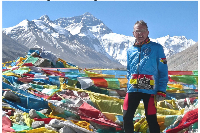
03) Au milieu des drapeaux de prières.