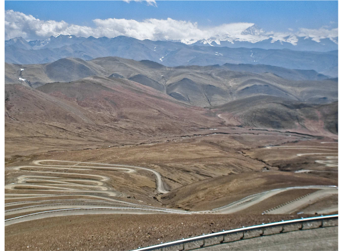
09) Une route et une montagne à perte de vue.