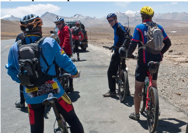
04) Nombreux regroupements pour l'escorte 4x4.